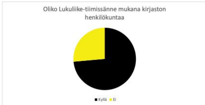
KUVIO 3. Lukuliike-tiimien kirjastoedustus

Kirjaston henkilökunnan vähyys vaikutti myös erään tiimin mukaan siihen, ettei heidän tiimissään ollut kirjaston edustajaa.