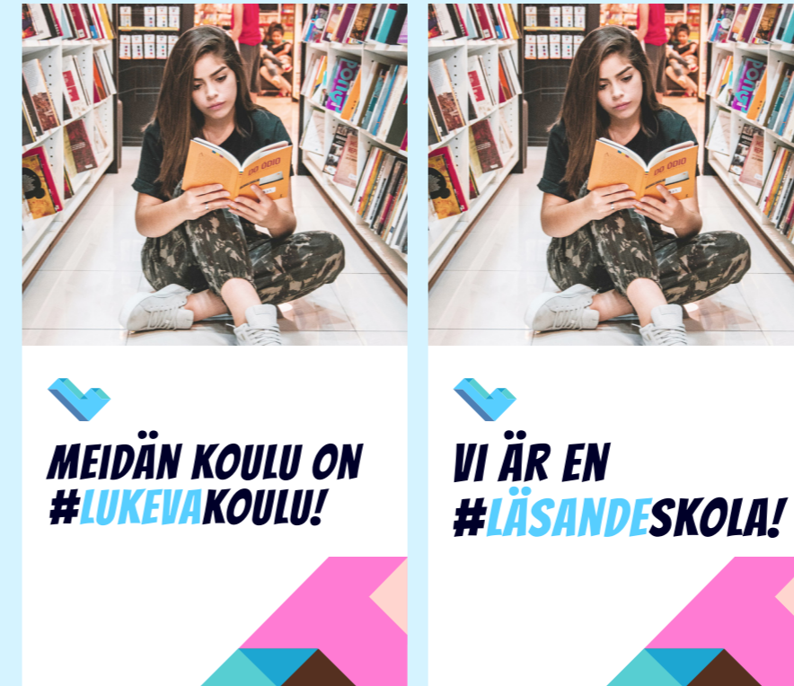
Mallipohja, johon koulu voi itse laittaa valokuvan. (Kuvan suositeltu paikka ja koko sama kuin yllä, eli reunasta reunaan, ja korkeus puolet koko kuva-alan korkeudesta.)